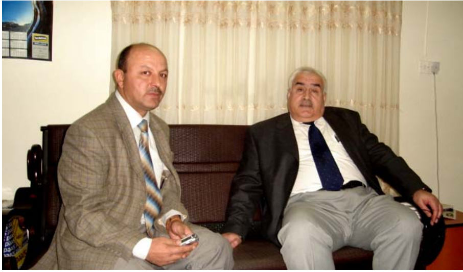
دیدار: ئه رشه د حیتو

✎ خواندنا ته بو بریارا په رله مانى توركى ب به زاندا سنورى باشوورى كوردستانى ب مه رما نه هیلانا (P.K.K) چیبه ؟ چ رهه ندا لدویف خو دهیلتا؟؟ به رشف: بریاره كا گرنگ بوویه ژلايى سياسته تا توركى فه، كو ئه ف بریاره حكومه ت و ده زگه هى له شكه رى توركى يى ئازاده بو به زاندا سنورى هه رىما كوردستانى و ژلايى دبلوماسى فه ئه ف بریاره بوویه ئه گه رى لئاندا كومه لگه هى نیف نه ته وه یی چ لسه ر ئاستى هه رىمايه تى یان جیهانى ژى بشیوه كى جدید ئه ف بابه تى له شكه ر كیشیا